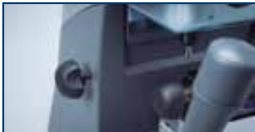
5 Blockierung der vertikalen Achse