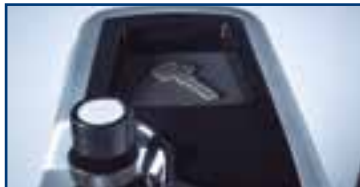
6 Im oberen Bereich Fach für Ablagefach