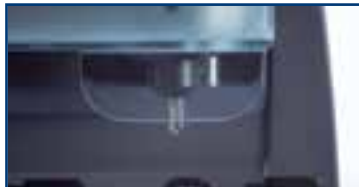
7 Schutzscheibe gegen Spanflug