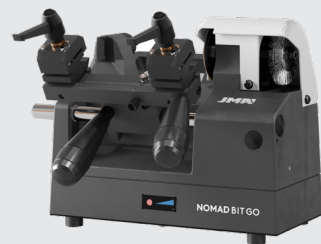
NOMAD BIT GO