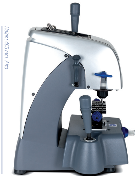
Height 465 mm. Alto

JMA's years of experience in the key-cutting world has made the CAPRI key-cutting machine a reality. It is a new generation machine, with many innovations: