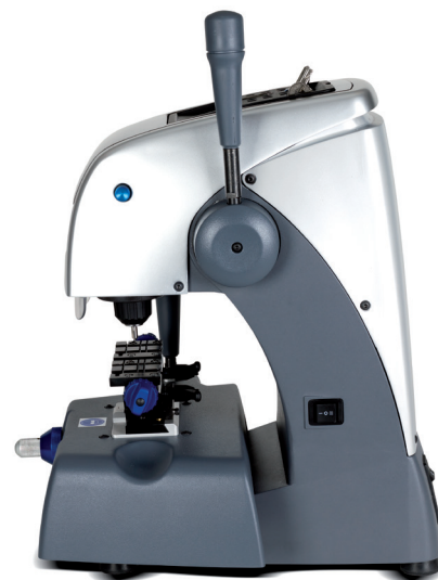
Depth 385 mm. Profundidad