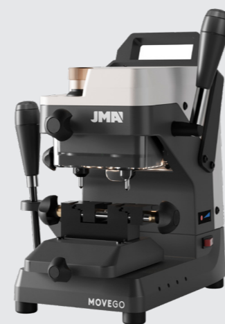
\ MOVE GO +